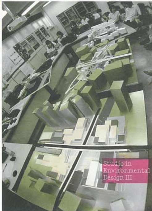
Studio in Environmental Design III