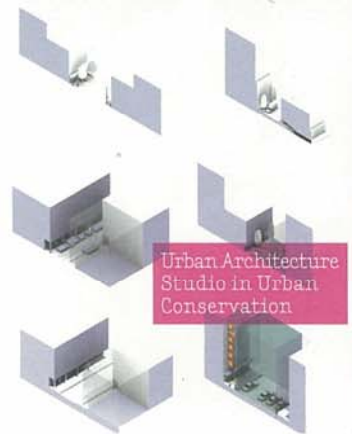
Urban Architecture Studio in Urban Conservation