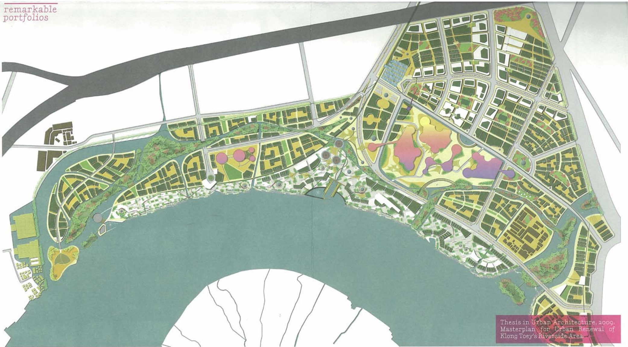
Thesis in Urban Architecture, 2009, Masterplan for Urban Renewal of Klong Toey's Riverside Area