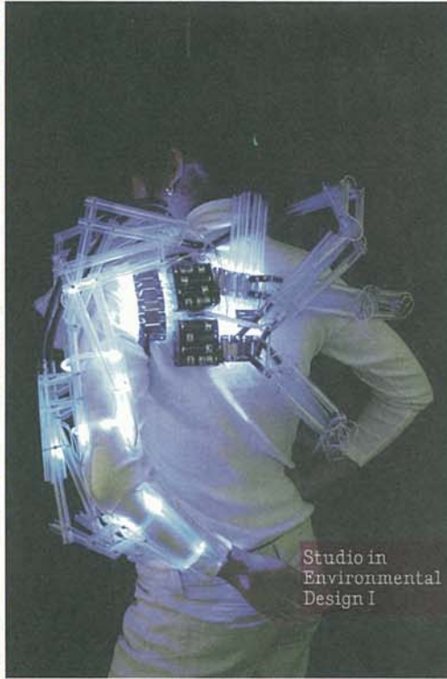
Studio in Environmental Design I