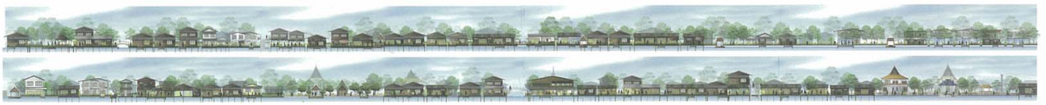
Urban Architecture Studio in Urban Conservation, 2009. Guidelines for building façade design of Klong Bang Luang Community's canal-side houses.