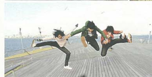
Urban Architecture fieldtrips in Bangkok and local provinces including Asian's cities; Kuala Lumpur, Melaka, Putrajaya, Singapore, Tokyo and Yokohama, 2007-2010