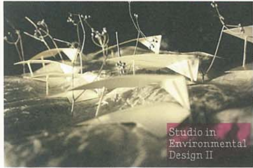
Studio in Environmental Design II