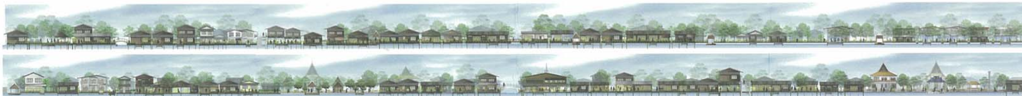
Urban Architecture Studio in Urban Conservation, 2009. Guidelines for building façade design of Klong Bang Luang Community's canal-side houses.